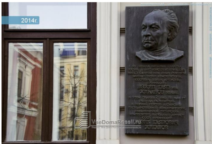
Мемориальная доска на фасаде Казанской государственной консерватории

В послевоенный период Н.Жиганов продолжает работать над излюбленным жанром – оперой . Появляются оперы «Тюляк и Су-Слу» - 1945 г., «Поэт» - 1947 г., «Намус» («Честь») – 1950 г., «Джалиль» - 1957 г. В этих операх композитор обращается к самым различным темам: это и историческое прошлое татарского народа, и эпические сказания и легенды, и современность. Но все эти оперы объединяет одно: в центре их стоят смелые и сильные люди. Перед нами предстают и герои национального эпоса, и наши современники, и герои-патриоты.